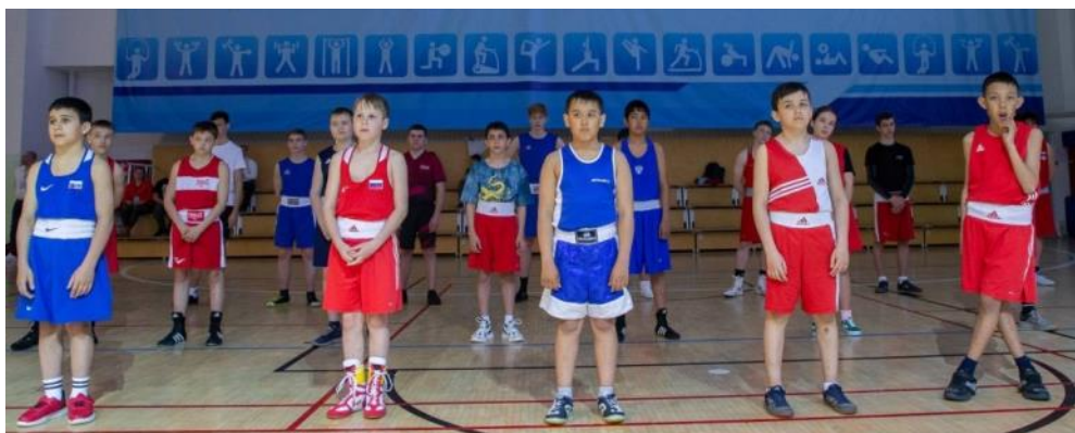
текст «Газпром добыча Уренгой профсоюз».

Одной из задач спортивного праздника встречи стало, помимо повышения спортивного мастерства участников, выявление самых подготовленных и способных спортсменов с целью формирования оперативного резерва для участия в будущих мероприятиях подобного формата. Со стороны сотрудников Общества уже есть к этому огромный интерес: в первом турнире приняли участие десять пар участников при том, что заявок было подано больше семидесяти. Это большая и многообещающая цифра. С учетом уже имеющегося опыта проведения турнира и при поддержке руководства предприятия огромным шагом вперед может стать проведение более масштабного турнира в будущем году, а общегородские мастер-классы с именитыми спортсменами войдут в новую добрую традицию.